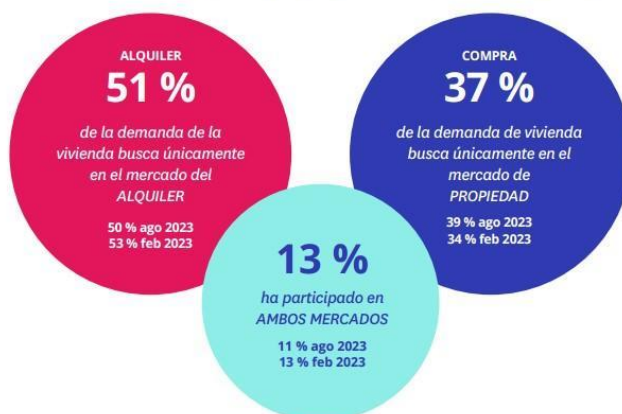
Demanda de vivienda de compra y de alquiler por parte de los jóvenes (18-34 años)

No obstante, el alquiler sigue siendo el mercado preferente para este grupo de población, ya que el 51% de los jóvenes busca exclusivamente un piso para arrendar . Este es un dato dos puntos porcentuales menor que el de 2023, pero todavía por encima del 49% de 2022. Por el contrario, se incrementa el porcentaje de jóvenes demandantes que únicamente han buscado vivienda en el mercado de la propiedad, pasando del 34% de febrero de 2023 al 37% justo un año después.